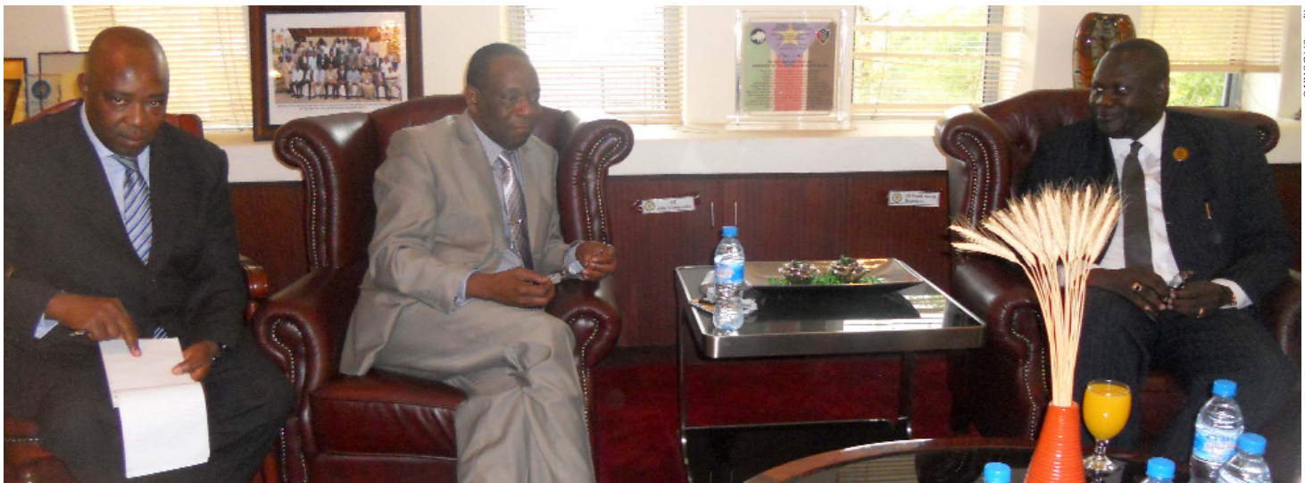
M. Riek Machar Teny Dhurgon, Vice-président du Soudan du Sud (à droite), lors de la réunion avec le Chef de l'UNOCA (à gauche) et l'Envoyé spécial de l'UA pour la LRA (au milieu).

15 - 16 janvier 2012, Ndjamena (Tchad) - Le Représentant spécial et Chef de l'UNOCA a représenté le Secrétaire général de l'ONU au 15 e Sommet de la Communauté économique des Etats d'Afrique centrale (CEEAC), à Ndjamena (Tchad). Il a délivré le message de circonstance de M. Ban Ki-moon lançant un appel pour une plus grande coopération transfrontalière entre les Etats d'Afrique centrale pour faire face aux nouvelles menaces, y compris la piraterie maritime, le trafic d'êtres humains et la prolifération des armes légères ainsi que l'insécurité sur les grands axes routiers reliant les Etats de la sous-région. Le message souligne que l'action collective serait le moyen le plus efficace pour s'attaquer à ces menaces. Par ailleurs,