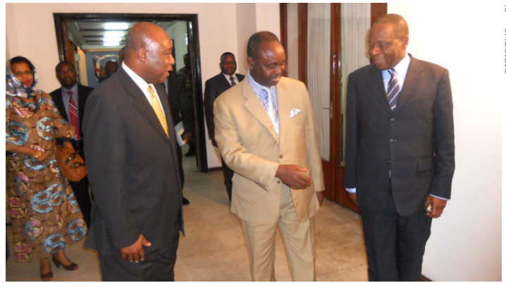
Le président centrafricain accompagnant ses hôtes après l'audience du 3 janvier

4 janvier 2012, Juba (Soudan du Sud) - Le Représentant spécial du Secrétaire général de l'ONU et Chef de l'UNOCA, et l'Envoyé spécial de l'UA pour la LRA sont reçus par le vice-président du Soudan du Sud, M. Riek Machar Teny Dhurgon. Ce dernier indique que les autorités prendront les dispositions diligentes pour fournir les installations nécessaires au démarrage effectif des activités des structures opérationnelles prévues dans le plan de lutte de l'Union africaine contre la LRA, notamment la Force régionale d'intervention et le Centre d'opération conjointe. L'ambassadrice des USA au Soudan du Sud, Mme Susan D. Page, a réaffirmé que son gouvernement reste très attentif à l'évolution de la situation, souhaitant que cette rébellion armée cesse le plus rapidement possible, compte tenu de son impact social et humanitaire.