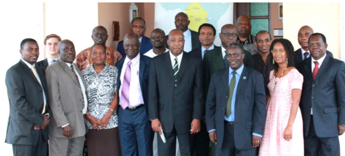
14 novembre : le Représentant spécial et les participants à l'atelier sur la médiation