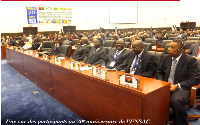
Une vue des participants au 20 e anniversaire de l'UNSAC