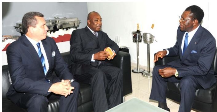
Audience avec le président Obiang Nguema Mbasogo le 11 novembre à Malabo