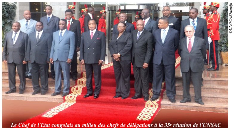
Le Chef de l'Etat congolais au milieu des chefs de délégations à la 35 e réunion de l'UNSAC