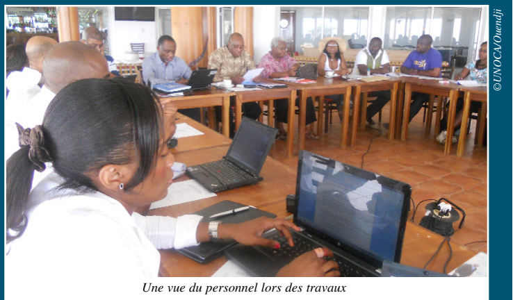
Une vue du personnel lors des travaux