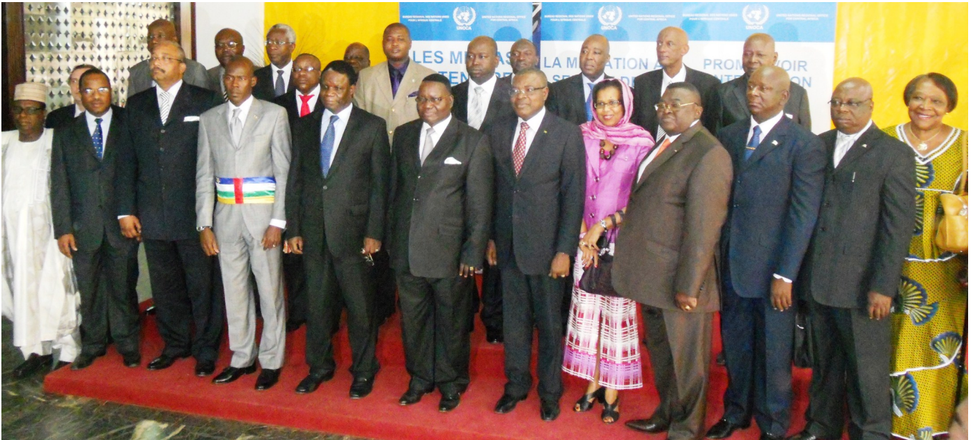
Les délégués des onze Etats membres de l'UNSAC et leurs partenaires internationaux après l'ouverture officielle de la 33e réunion à Bangui, en RCA

La 34 e réunion du Comité consultatif permanent des Nations Unies chargé des questions de sécurité en Afrique centrale (UNSAC) aura lieu du 14 au 18 mai à Bujumbura, la capitale du Burundi. Elle permettra aux experts et aux ministres des Affaires étrangères des pays membres d'évaluer la situation géopolitique et sécuritaire, et de proposer des solutions concertées aux problèmes qui menacent la paix et la stabilité de la sous-région.