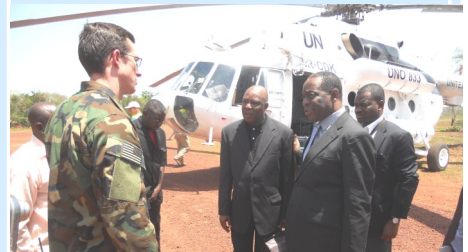
Avant de se rendre au Tchad, la mission conjointe de l'ONU et de l'UA était, entre autres, à Obo (RCA) le 14 avril. Elle y a rencontré les conseillers militaires américains déployés dans la région fin 2011.

La mission conjointe de l'ONU et de l'UA surveillait une semaine après celle effectuée en République démocratique du Congo (RDC) et en RCA du 10 au 15 avril. Celle-ci a permis d'évaluer le chemin parcouru dans la mise en œuvre de l'Initiative de coopération régionale de l'Union africaine contre la LRA et de constater qu'il est de plus en plus urgent de mettre rapidement fin aux atrocités de ce groupe armé à l'origine, depuis 2008, de plus de 2400 morts, au moins 3400 enlèvements et plus de 440 000 déplacés internes ou réfugiés.