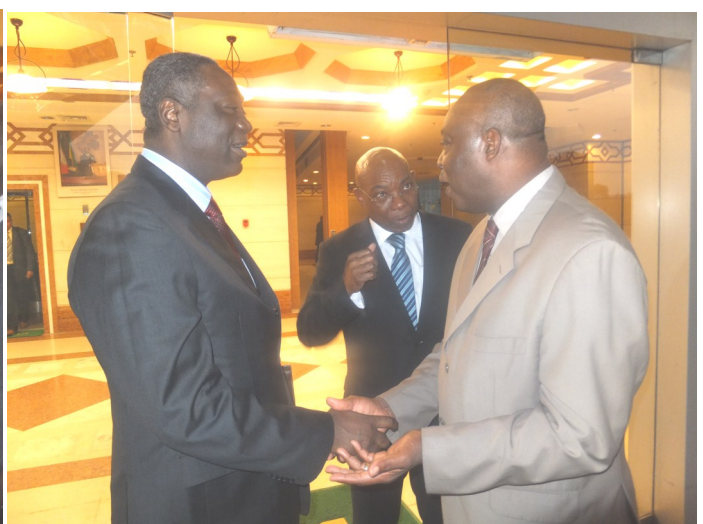
Le Chef d'Etat major des Forces armées tchadiennes et le Chef de l'UNOCA, qui a aussi rencontré les ambassadeurs du Cameroun et de Sao Tome et Principe