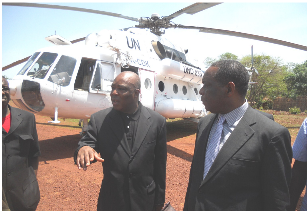
Obo (Sud Est de la RCA), 14 avril 2012. - M. Abou Moussa (au milieu), lors d'une mission conjointe avec M. Francisco Madeira, Envoyé spécial de l'Union africaine pour la LRA. Obo est l'une des régions les plus affectées par la LRA.

Inauguré le 2 mars 2011, l'UNOCA avait un mandat initial arrivant à expiration le 30 août 2012. Le Bureau est basé à Libreville et est dirigé par M. Abou Moussa, Représentant spécial du Secrétaire général de l'ONU pour l'Afrique centrale. Il couvre les dix pays de la CEEAC : Angola, Burundi, Cameroun, République Centrafricaine, Congo, Gabon, Guinée Equatoriale, République démocratique du Congo, Sao Tome et Principe, et Tchad.