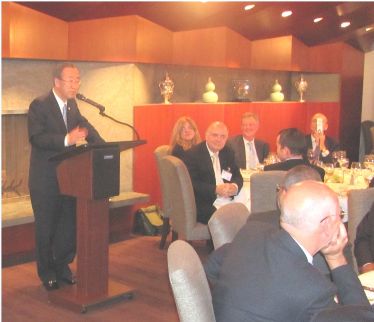
Le Secrétaire général a salué les actions de ses représentants sur le terrain.