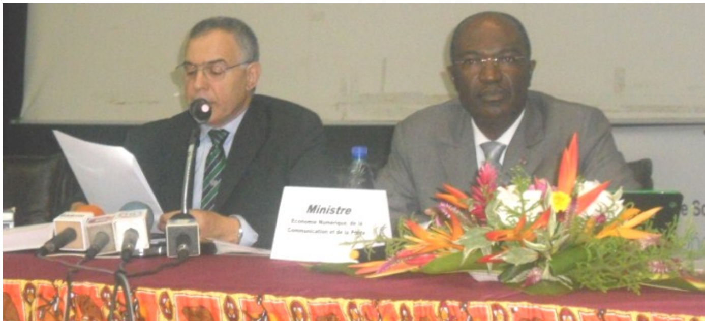
Libreville, 3 mai 2012. M. Mohammed Bachiri, Représentant résident de l'UNESCO (à gauche) et M. Blaise Louembe, ministre de l'Economie numérique, de la Communication et de la Poste lors de la cérémonie officielle de lancement des activités du 3 mai.

A Libreville, la 21 e Journée internationale de la liberté de la presse célébrée le 3 mai a été marquée par plusieurs activités centrées sur le thème : « les nouvelles voies : la liberté des médias au service de la transformation des sociétés ». Un « Forum-Atelier » ( De médias d'Etat à médias de service public : implications et enjeux ) a aussi eu lieu le 4 mai.