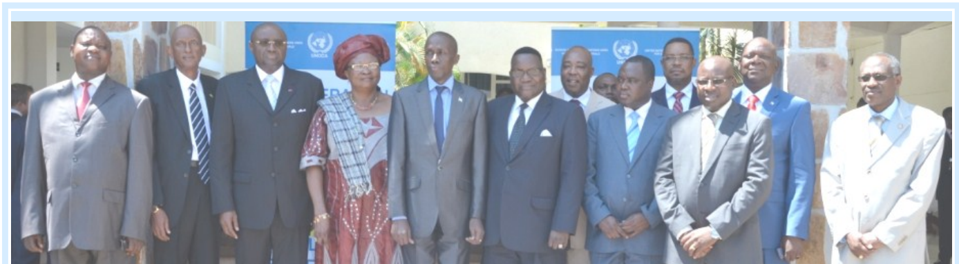
Sur les onze pays membres de l'UNSAC, huit étaient représentés au niveau ministériel et trois par des hauts fonctionnaires ou des experts chevronnés. Avant de quitter Bujumbura, ils ont pris une photo souvenir avec le Représentant spécial et chef de l'UNOCA (7 e à partir de la gauche).