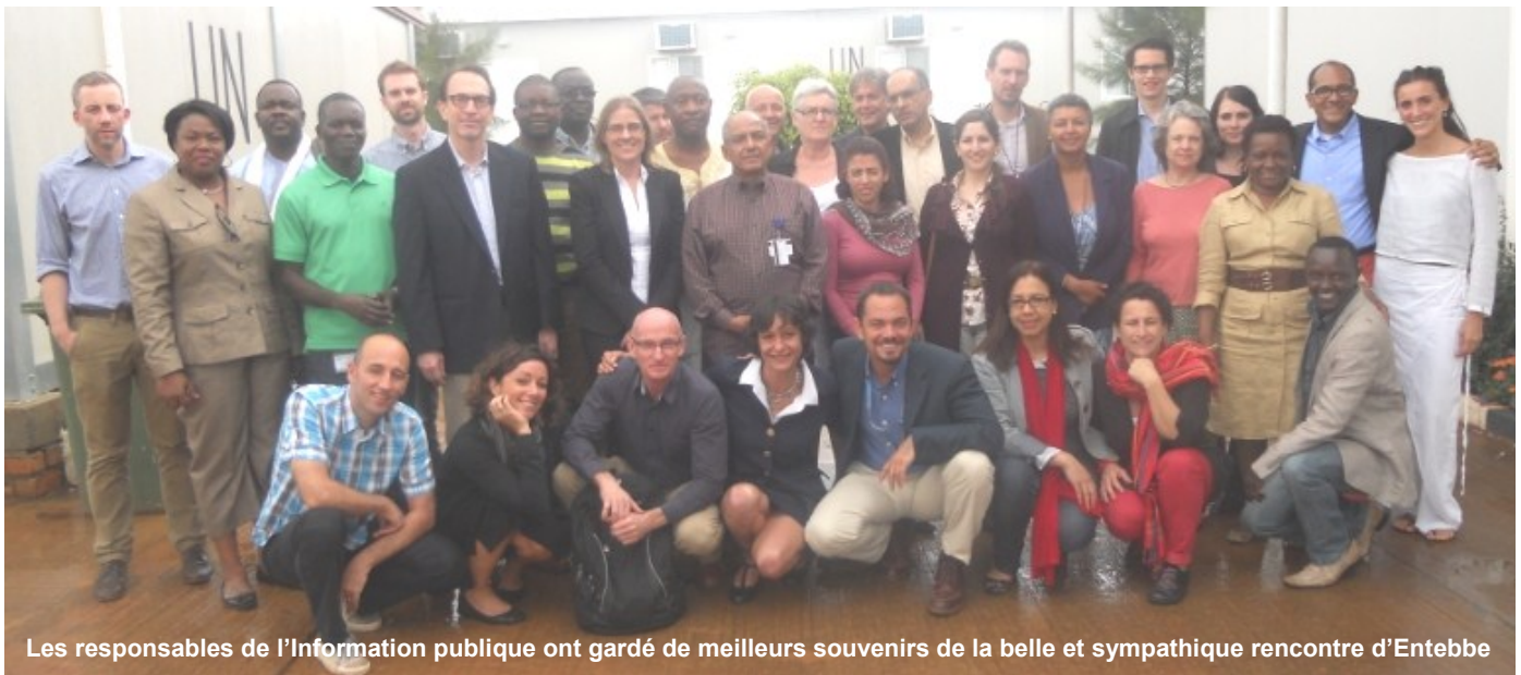
Les responsables de l'Information publique ont gardé de meilleurs souvenirs de la belle et sympathique rencontre d'Entebbe

tions essentielles relatives à la fonction de PIO et d'examiner les défis à relever dans un contexte de crise de ressources. Les bonnes pratiques dans divers domaines de l'information et de la communication occupaient aussi une place de choix dans les débats. Kieran Dwyer (Section Affaires publiques/DPKO - DFS),