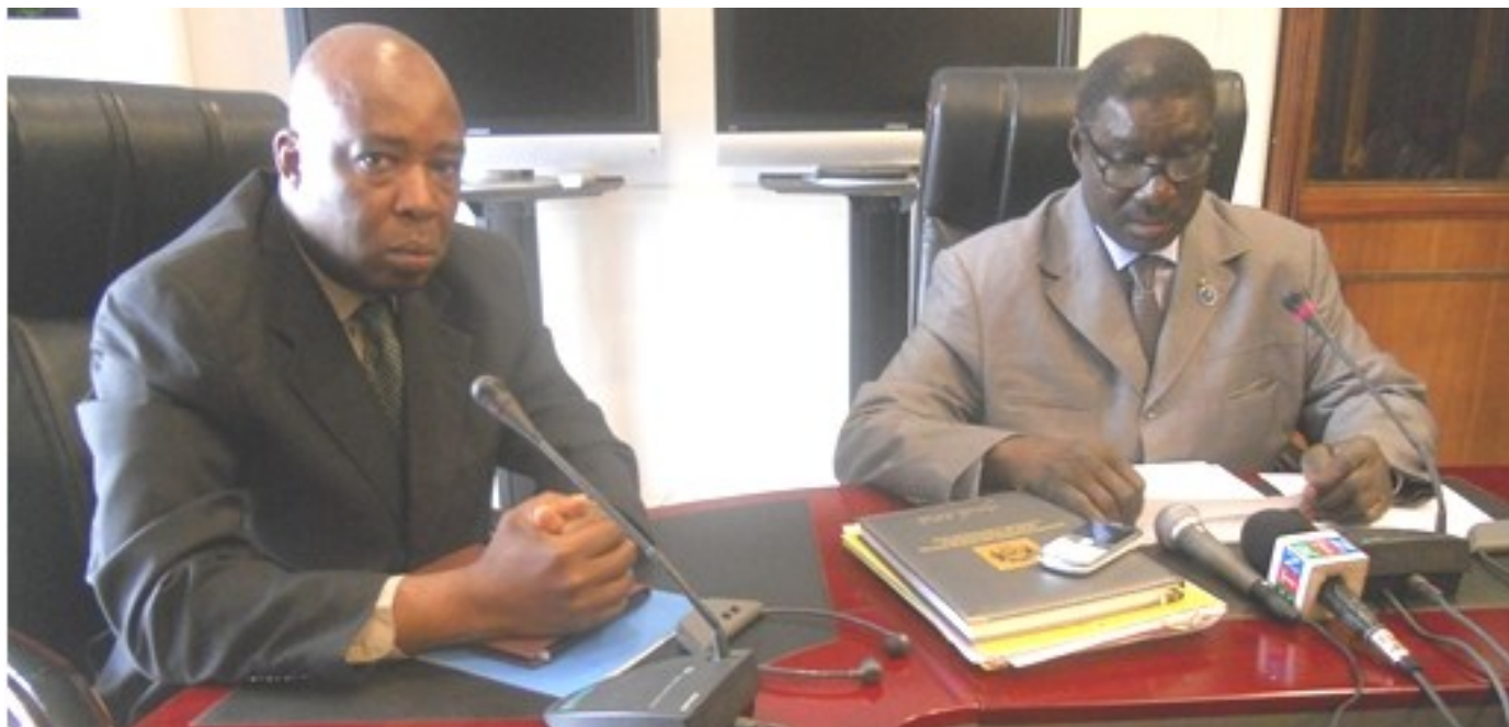
La collaboration entre le Représentant spécial du SG de l'ONU et chef l'UNOCA, et le Secrétaire général de la CEEAC est en marche