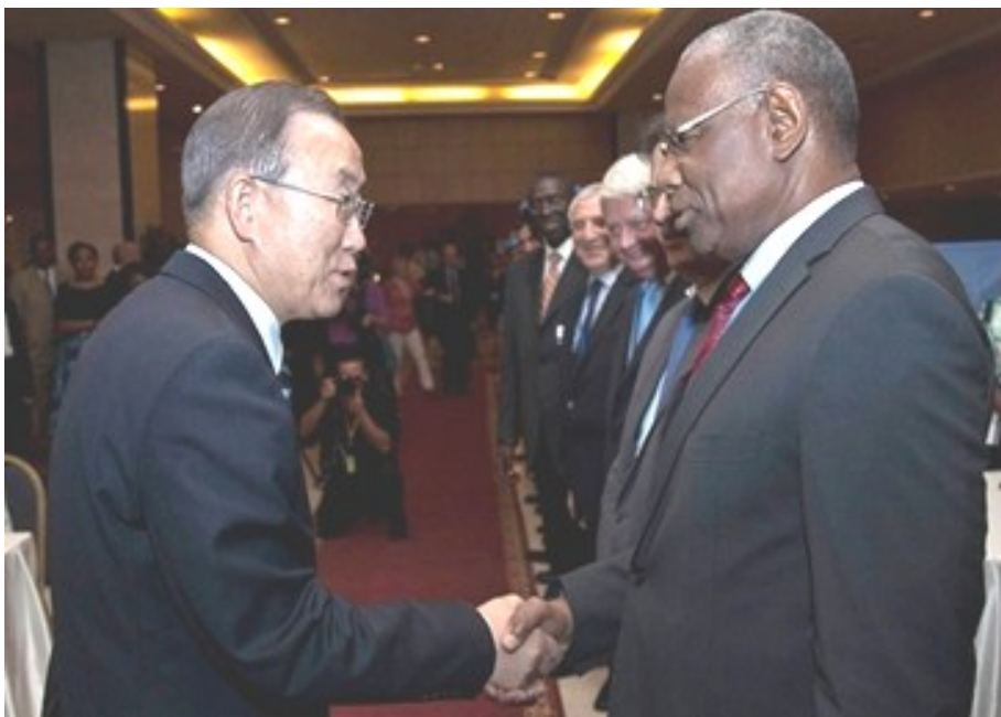
Le SG de l'ONU et M. Bathily lors d'une mission à Bamako en novembre 2013